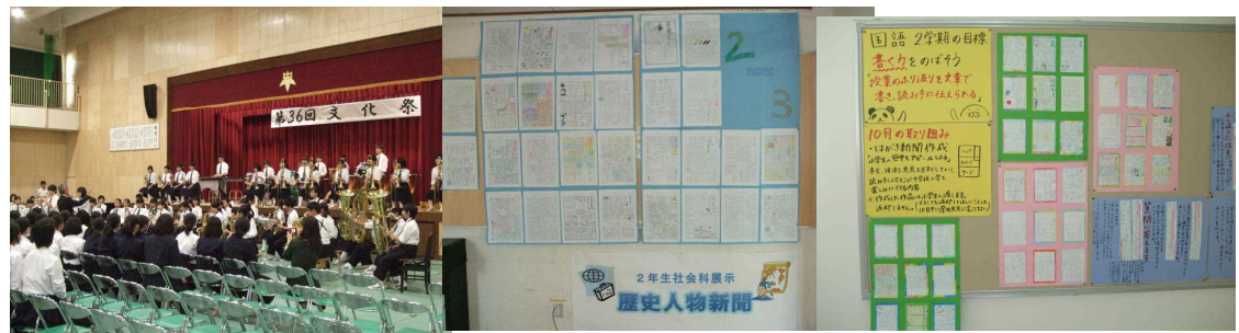
<午後の舞台発表：吹奏楽部> <展示の部：2年社会科> <展示の部：1年国語科>