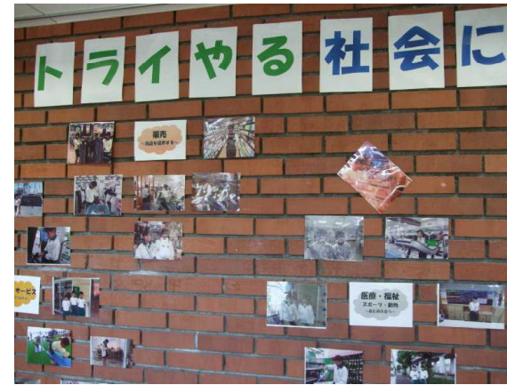
(トライやる活動写真)

145名が、58事業所に分かれて職場体験学習を行いました。関係者の皆様、PTAの皆様には色々とお世話になり、心より感謝申し上げます。私も数カ所事業所訪問をさせていただきましたが、「礼儀正しいです」「昼休みの後自分たちで次にすることをさがしてくれました」「もっと来てほしいです」など、お褒めの言葉をいただいた事業所があり、嬉しかったです。事後学習として、「事業所へのお礼状書き」(※すでに、野間郵便局や美鈴郵便局などから8名の局長様、局員様が授業をしてくださいました。反応がよくて、授業のやりがいがありましたと、褒めてくださいました。ありがとうございました。) 「スピーチ発表」「新聞作り」「活動記録集作り」などを行います。今回の体験を振り返る中で、自分の将来の夢や特性について考え、3年生での「進路学習」につなげていって欲しいと思います。