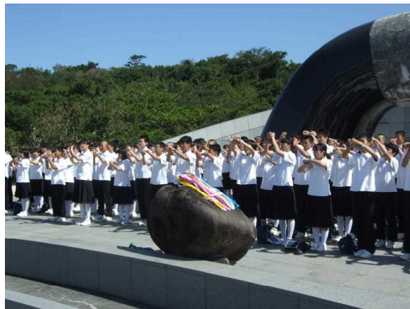
(1日目:平和セレモニー)

「さすがは3年生!」の一言でした。実行委員を中心に「自治集団の集大成」「自立・自律」を目指した質の高い修学旅行だったと思います。いろんな場面でみなさんが褒められ、笹中の職員としてとても嬉しかったです。また、平和セレモニーでの学年合唱「花は咲く」は感動しました。さらに、民泊お別れ式でのお礼に、急遽「花は咲く」を歌う姿は、民泊での充実ぶりをよくあらわしていました。これからの学校生活で「自立・自律」の完成を目指し、「笹中の歴史をつくる」見本になる学年だと実感しました。