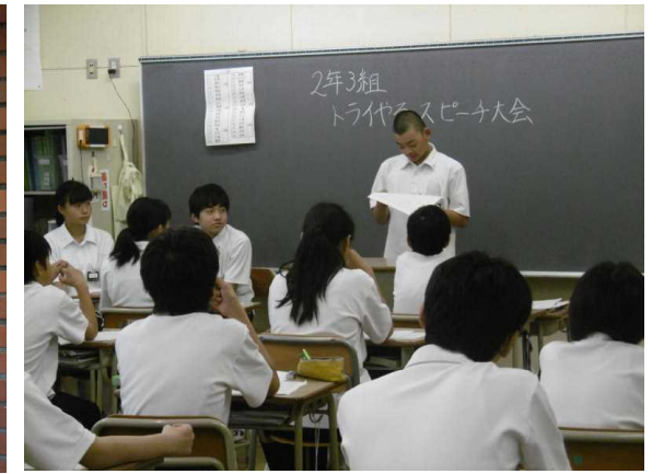
(事後学習「トライやるスピーチ大会」)