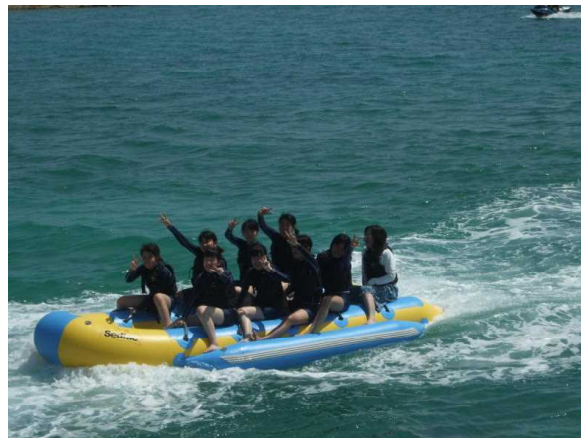
(2日目:マリンスポーツ体験)